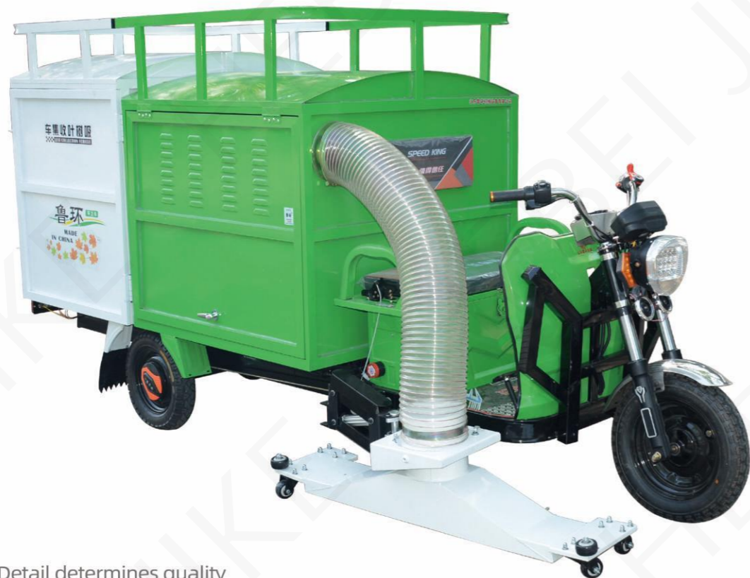
细节决定品质/Detail determines quality