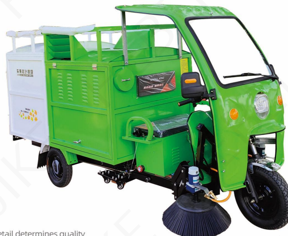
细节决定品质/Detail determines quality